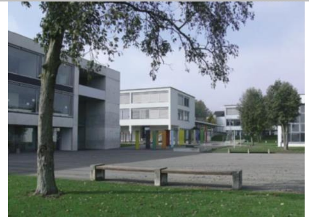
Organisation und Zuständigkeiten