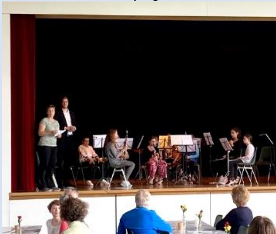
Den Auftakt machte „Crescendo“