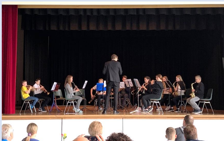
Zugabe des Ensembles „Vivace“

Im Anschluss gab es drinnen wie draussen Spiele für Gross und Klein. Eine Mal- und Bastelecke sowie ein Kafi mit allerlei Leckereien. Das von BEN organisierte Rahmenprogramm wurde auch gerne genutzt, auch wenn die Besucherzahl diesmal eher bescheiden war. Den Anwesenden hat es aber sichtlich gefallen und so ging ein kurzweiliger Nachmittag mit fröhlichen Gesichtern zu Ende.