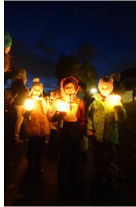
BEN (Benzenschwiler Eltern Netzwerk)

Nicht nur deswegen, auch sonst konnte das nasskalte Wetter die gute Stimmung nicht trüben. Gut gelaunt marschierte der Zug zum Schluss zurück zum Schulhaus. Das übliche Buffet für Gross und Klein musste dieses Jahr zwar den Corona-Bestimmungen weichen. Für die Kinder gab es aber dennoch eine kleine Stärkung. Haben sie doch mit ihren Liedern und strahlenden Gesichtern nicht nur den kalten Herbstabend erwärmt.